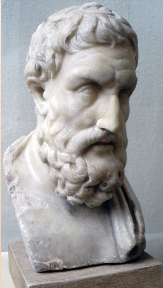
Bust of Epicurus, Pergamon Museum, Berlin